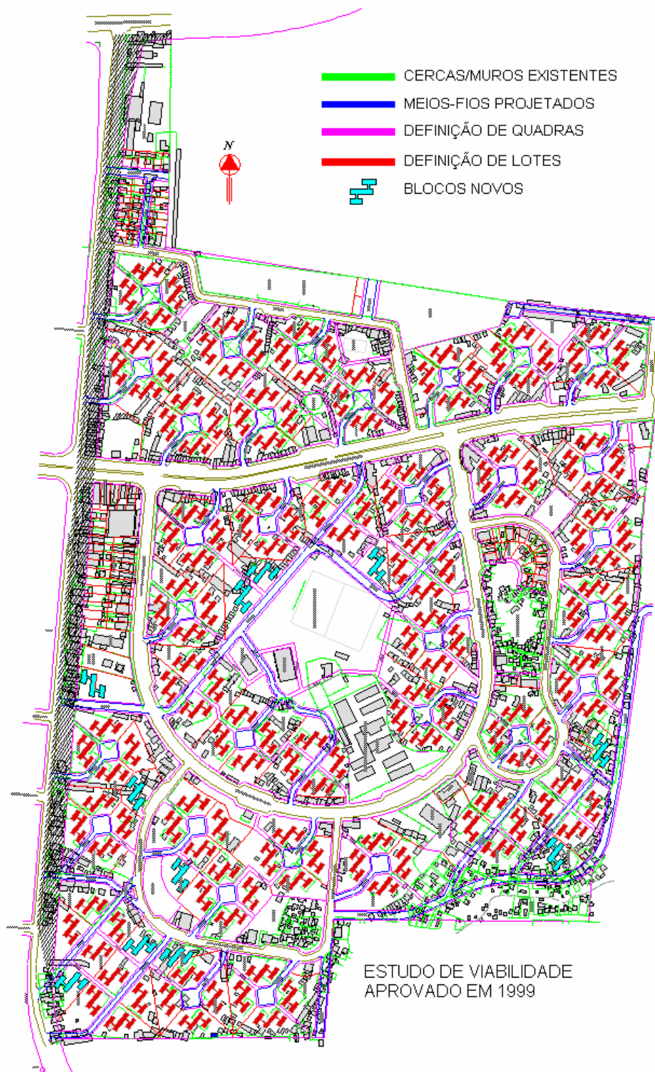
Fig. 4 Estudo de Viabilidade aprovado em 1999. Empresa Aerogeo .