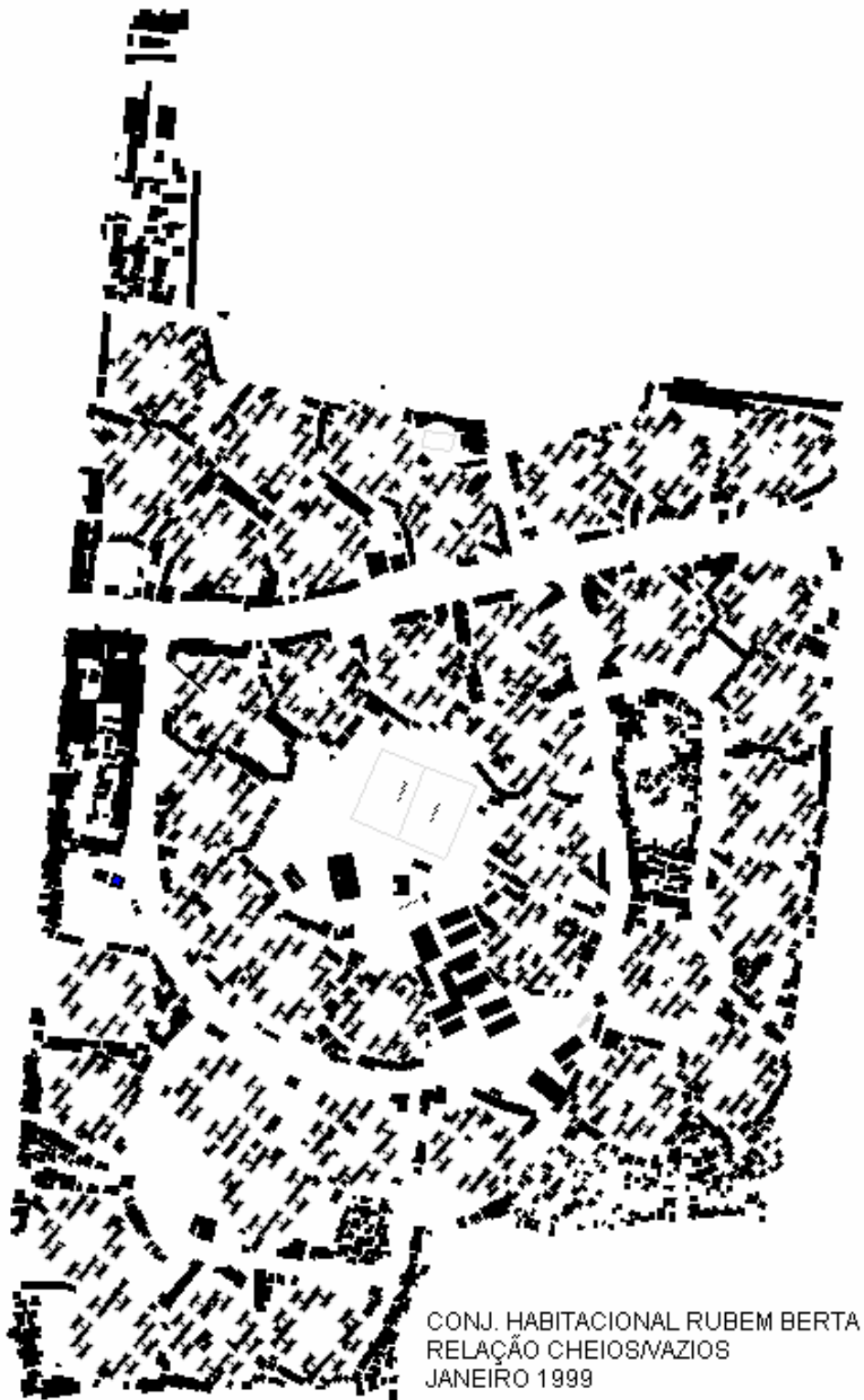
Fig. 5 Gráfico cheios e vazios, feito pela autora a partir do levantamento da Aerogeo.