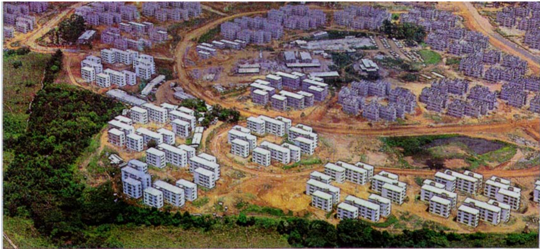
Fig. 1 Vista Aérea Conjunto Rubem Berta.