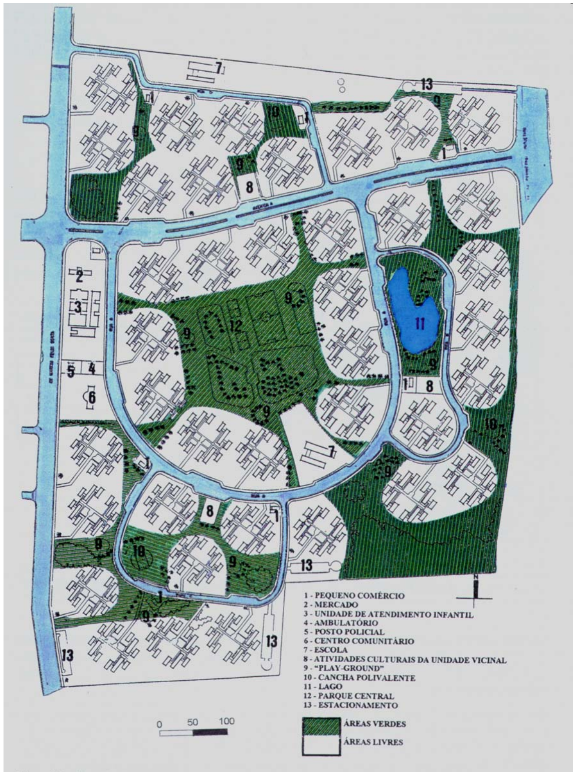
Figura 3 Planta Baixa do projeto original. Fonte: Rigatti, Décio. Do espaço projetado ao espaço vivido: modelos de morfologia urbana no conjunto Rubem Berta Tese de Doutorado, São Paulo, 1997.