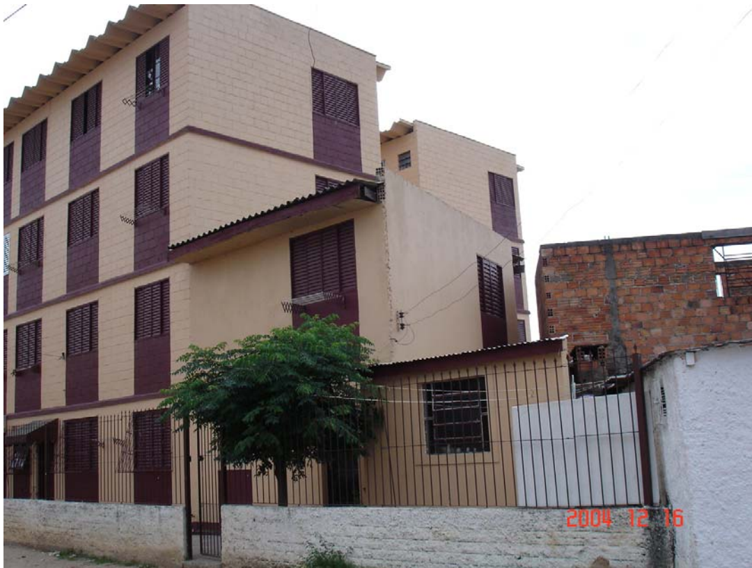
Fig. 6 Exemplo das extensões de apartamentos feitas pelos moradores, bem como da execução dos muros